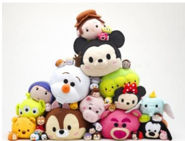
発売以降、若い女性を中心に 変わらぬ人気を誇るディズニーやピクサーのツムツム