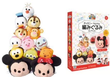
(左) 大きささまざまなツムツムの編みぐるみ (右) 隔週発行の「ディズニー ツムツム 編みぐるみコレクション」

タカラトミーは、2016年3月17日より、ツムツムをモチーフとしたダイキャスト製ミニカーのトミカ「ディズニーモーターズ ツムツム」シリーズの4thシーズンを発売いたします。同シリーズは昨年4月に1stシーズンを発売以降、既に販売数100万個を突破している人気商品です。新シーズンでは「アナと雪の女王」のキャラクターや、ウッディ、オズワルド、ペリーといった人気キャラクターのトミカが登場します。