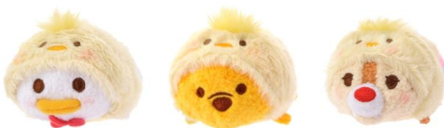
人気キャラクターのツムツムたちがひよこのコスチュームで登場

TSUM TSUM Sサイズ 600円(税別) TSUM TSUM セット 3,500円(税別)