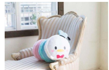
抱きしめたりアームクッションとして使える 「ドナルド マカロン抱き枕」