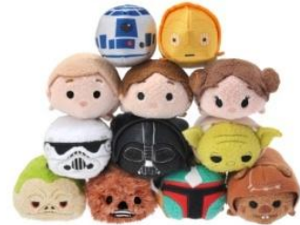
発売後、即日完売となった スター・ウォーズのツムツム