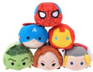
今年新たに登場し、注目を集める マーベルのツムツム