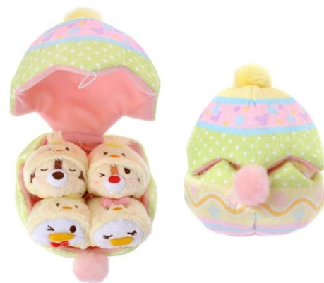
エッグに収納できる TSUM TSUM セット