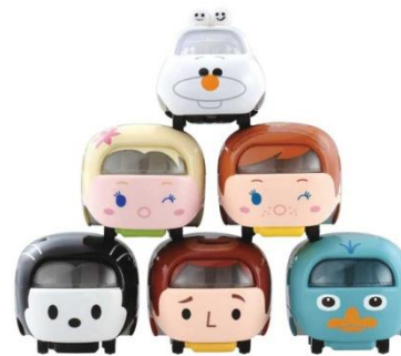
積み上げて楽しむ「ディズニーモーターズ ツムツム」 シリーズの4thシーズン