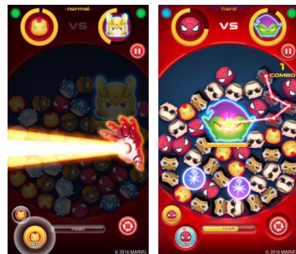
マーベルヒーローズそれぞれのスキルや 協力プレイができるバトルモードも魅力