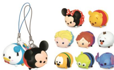
ゲームと連動したアーケード版限定のツムマスコットも新たに5種類が公開