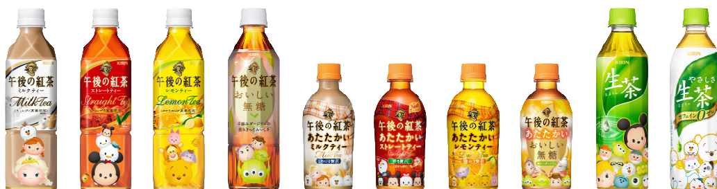
※画像は対象商品の一部となります。