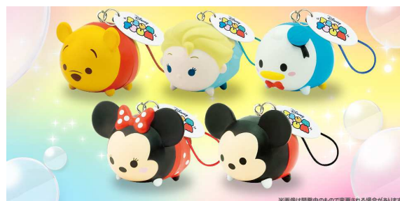
ゲームと連動したアーケード版限定のツムマスコットも登場