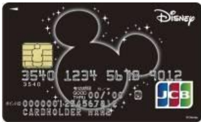
ミッキー・マウス(ブラック)