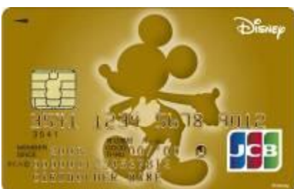
ミッキー・マウス(ゴールド)