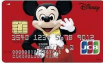
ミッキー・マウス(レッド)