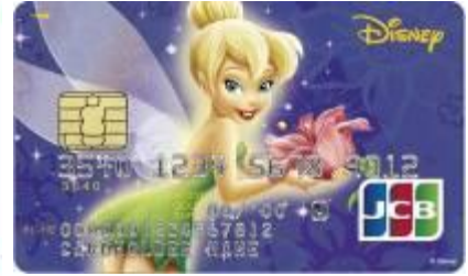
ティンカー・ベル