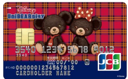
ユニベアシティ(モカ・プリン)