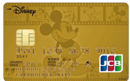
ミッキー・マウス&フレンズ