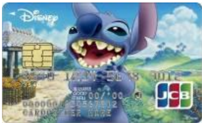
スティッチ(アイランド)