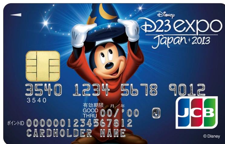
「ディズニー★JCBカード」 「D23 Expo Japan 限定カード」デザイン