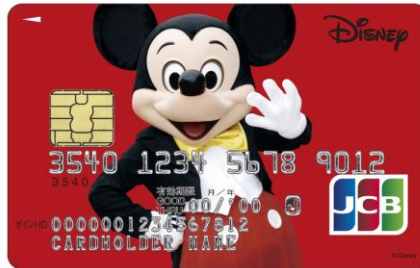
ミッキー・マウス (レッド)