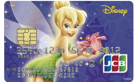
ティンカー・ベル