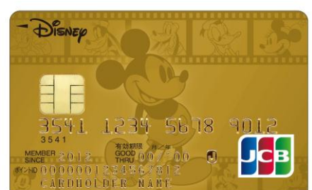
ミッキー・マウス&フレンズ