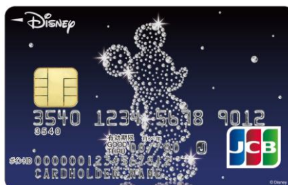
ミッキー・マウス (クリスタル)