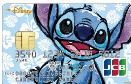
スティッチ (ハイビスカス)