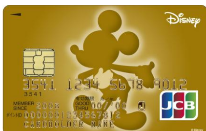
ミッキー・マウス (ゴールド)