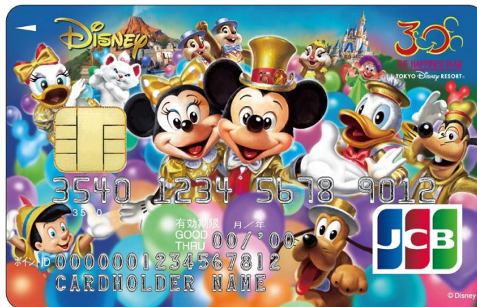
「ディズニー★JCBカード」 「東京ディズニーリゾート®30周年記念カード」デザイン

ウォルト・ディズニー・ジャパン株式会社（本社：東京都目黒区、代表取締役社長：ポール・キャンランド、以下：ディズニー）と株式会社ジェーシービー（本社：東京都港区、代表取締役兼執行役員社長：川西 孝雄、以下：JCB）は、「ディズニー★JCBカード」12種類の通常カードラインナップに加え、「東京ディズニーリゾート®30周年記念カード」を2013年3月15日（金）から2014年3月20日（木）まで、期間限定にて募集いたします。