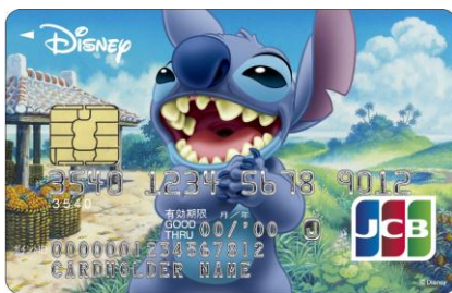
スティッチ (アイランド)