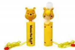
©Disney. Based on the "Winnie the Pooh" works by A.A. Milne and E.H. Shepard.