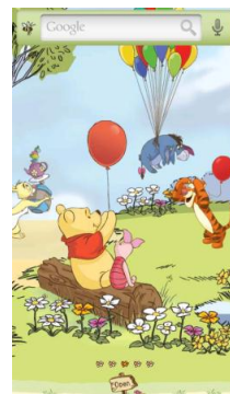
©Disney. Based on the "Winnie the Pooh" works by A.A. Milne and E.H. Shepard.

dメニュー(NTTドコモ)から メール／コミュニティ／投稿 > デコメール／メール > キャラクター