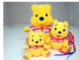
©Disney. Based on the "Winnie the Pooh" works by A.A. Milne and E.H. Shepard.

節電中のあつーい夏も、どこでもプーさんと一緒に涼めます！ 持ち運びも簡単な愛くるしいハンディファンなので、プレゼントにもおすすめ！