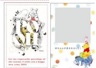
©Disney. Based on the "Winnie the Pooh" works by A.A. Milne and E.H. Shepard.