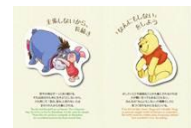
©Disney. Based on the "Winnie the Pooh" works by A.A. Milne and E.H. Shepard.