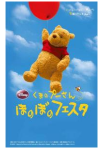
Based on the "Winnie the Pooh" works by A.A. Milne and E.H. Shepard.

◇ お問い合わせ先：くまのプーさん ほのぼのフェスタ事務局 TEL:03-6712-0221