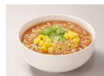
©Disney. Based on the "Winnie the Pooh" works by A.A. Milne and E.H. Shepard.